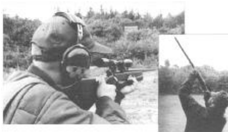
Veilig wapenbezit bij jacht en schietsport

Aangezien jaarlijks, verspreid over de hele regio, enkele duizenden jachtakten en verloven moeten worden afgegeven, dan wel verlengd (hetgeen administratief bijna op hetzelfde neerkomt), wordt gebruik gemaakt van een geautomatiseerd systeem. Dit houdt in dat uw persoon-, vergunning- én wapen gegevens in dit systeem worden ingebracht. Op dit geautomatiseerde systeem is een privacyreglement van toepassing dat desgewenst voor u ter inzage ligt.