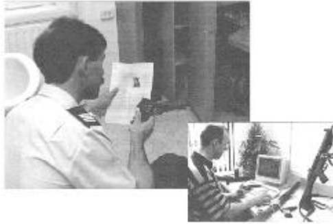
Controle, ook bij u thuis!!!